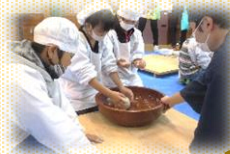
ふるさと体験の日「蕎麦うち」

*子どもたちの姿* ・自分で問いを持ち、友と意見交換することに喜びを感じる子が増えてきている ・指示や注意を素直に受け入れられる ・学年を超えてまとまって活動できる ・体験的活動に意欲的に取り組める