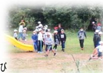
児童会による全校遊び