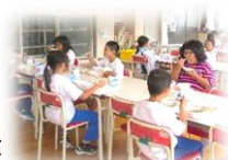
地元の食材を豊富に使った給食